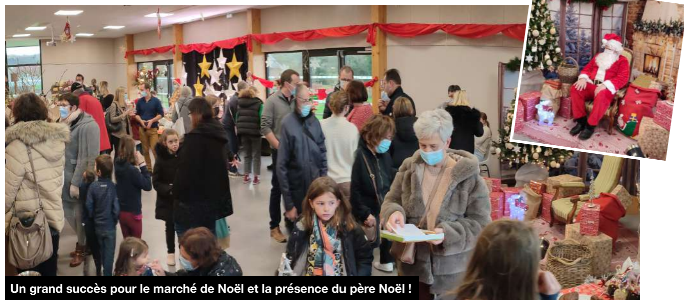
Un grand succès pour le marché de Noël et la présence du père Noël !