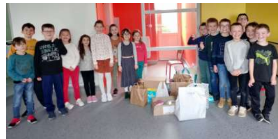
Les élèves peuvent être fiers de la collecte !

Deux collectes de biens de première nécessité (produits d'hygiène et de santé, conserves, couvertures, sacs de couchage, lits de camp...) au profit du peuple ukrainien ont été organisées le samedi 12 mars et le mardi 15 mars par la municipalité, l'APE, l'école, l'Amicale des gens heureux et Rataouille. Après dépôt en mairie, ces dons ont été livrés à Cherbourg, dans les locaux de la Protection civile, avant d'être acheminés en Ukraine. Une collecte avait déjà eu lieu le samedi 04 mars à la mairie, afin de répondre à l'initiative d'une jeune ukrainienne de Cherbourg qui affrétait en urgence un premier camion d'aide humanitaire.