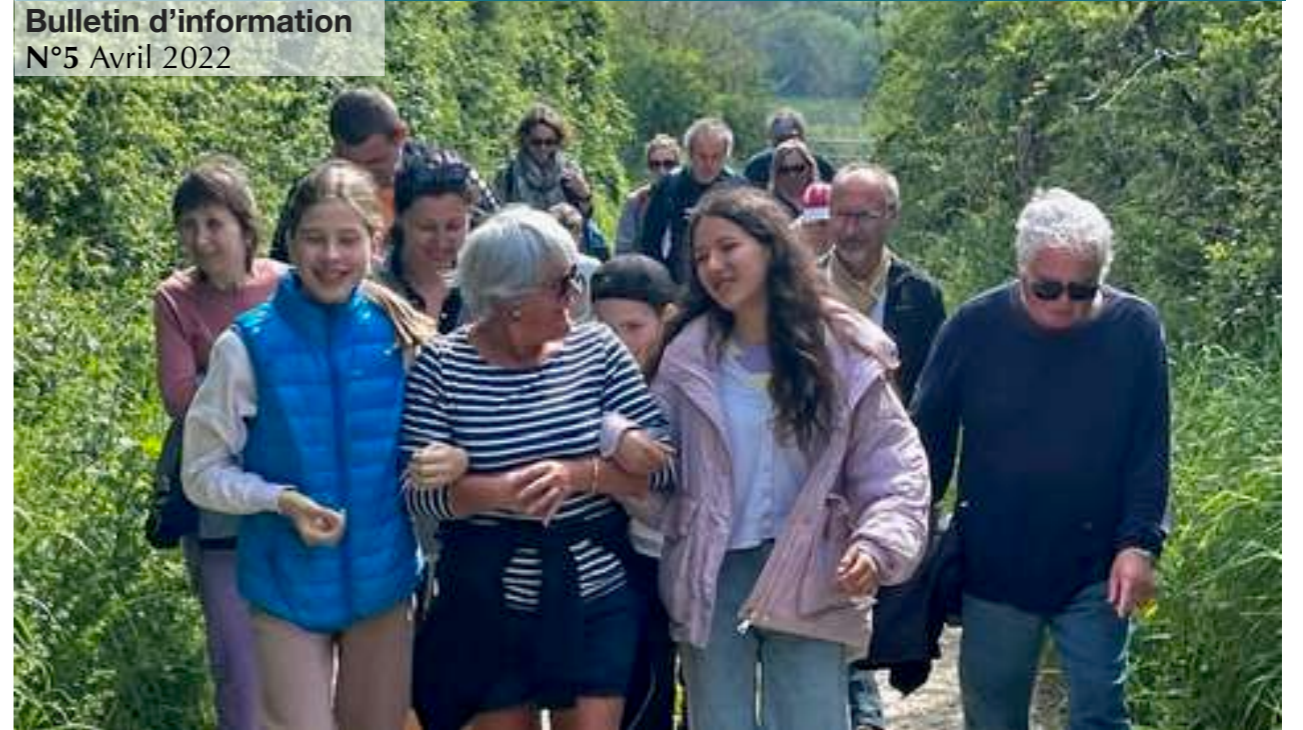
Balade le 23 avril à Diélette, rassemblant des habitants de Héauville et Siouville et des réfugiés ukrainiens