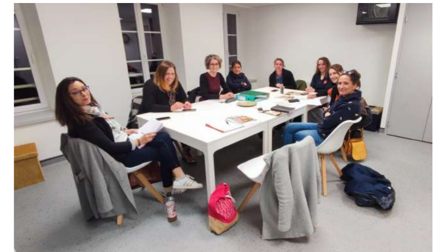
Réunion de l'APE du 29 mars

Une fois les travaux terminés en tout début d'année, plusieurs membres de l'équipe municipale et habitants de Héauville ont entrepris d'aménager les locaux situés à l'étage de l'école communale, là où se situait jadis un logement. Plusieurs équipes se sont mises à l'œuvre. L'une s'est rendue à Caen et autour de Cherbourg afin d'acheter directement et de transporter des meubles et divers équipements. But de l'opération : bénéficier de prix beaucoup moins élevés que ceux affichés dans les catalogues de fournitures aux communes. Une autre équipe a pris le relais pour assembler et monter les meubles, ainsi que pour effectuer des fixations aux