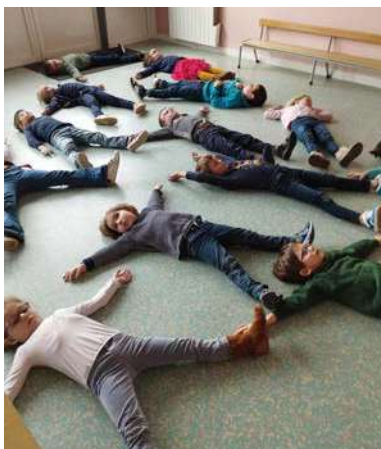
Séance de yoga

Durant l'année scolaire, les enfants de GS/CP ont pu découvrir le yoga. Ils ont pu suivre des cours de natation, continuer à entretenir le potager sur Héauville et un